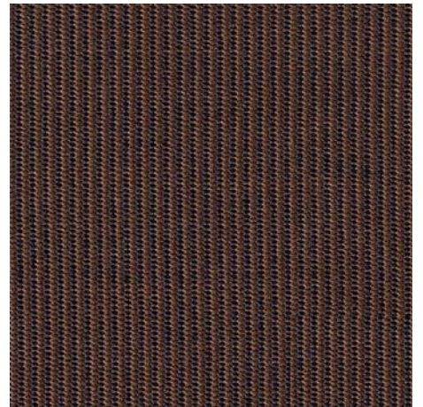
10 braun | brown

100% Polyester (PES) Webstoff / Woven fabric, 140 cm