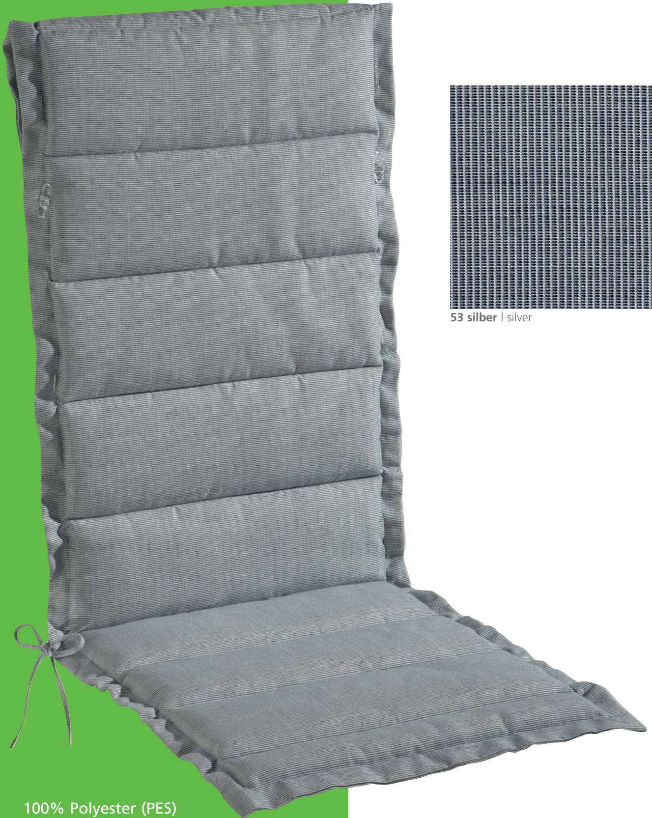
53 silber | silver

100% Polyester (PES) Webstoff / Woven fabric, 140 cm